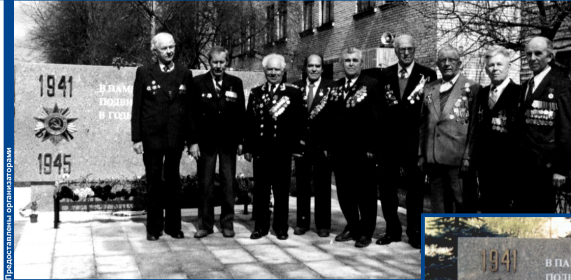
Они сражались за Родину, защищали Ленинград.

...Еще до начала страшной войны главным направлением основанного в 1891 году предприятия стала оборонная продукция. Здесь делали узлы и агрегаты для первых отечественных танков, производили броневые противотанковые снаряды. Руководители страны понимали: война не за горами. В сентябре 1939-го Совет Народных Комиссаров принял программу перевооружения Военно-воздушных сил, и вскоре завод перевели в только что созданный наркомат авиационной промышленности. Частично поменялась и специализация.