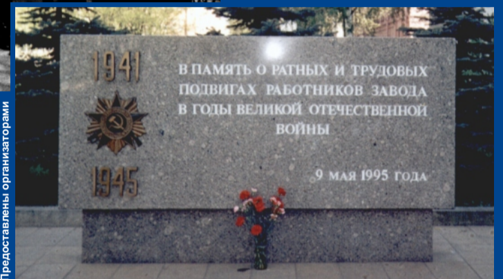
Этот памятный знак открыли к 50-летию великой Победы.

Авиадвигатели семейства М-105/ВК-108 в годы войны устанавливали на самые массовые истребители и бомбардировщики. Конструкция М-105 позволяла устанавливать на «яки» пушки калибром 45 и 57 миллиметров, что на порядок увеличивало их огневую мощь.